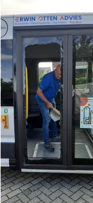
Even Herman Slot Bellen....