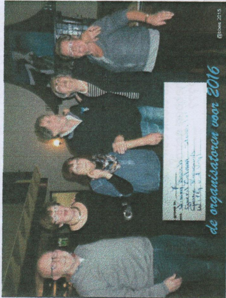
de organisatoren voor 2016

De verrassing was wel dat de vierde prijs, de meest on-dankbare, het volgend jaar het entertainmentgedeelte mag verzorgen. Intussen stond er een heerlijk koud- en warm buffet voor iedereen klaar.